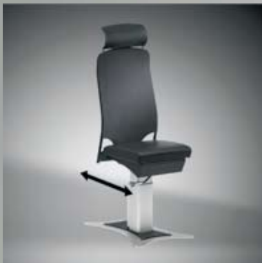
Sitzverschiebung, elektromotorisch oder manuell / I Seat displacement, electromotive or manual