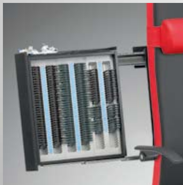
Gläserkasten, klein / Trial lens drawer, small