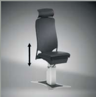
Höhenverstellbar / Height adjustable