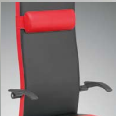
Armlehnen, verstellbar / Nackenkissen, höhenverstellbar / Tilting arm rests / Bolster height adjustable