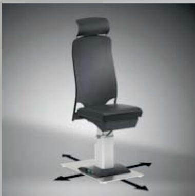
Stuhlverschiebevorrichtung / Chair displacement