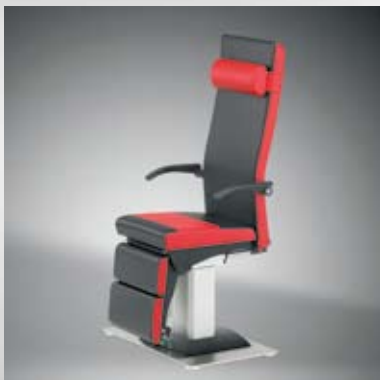
Oberteil 360° drehbar mit Rastung alle 90° / Rotary mechanic 360° with locking every 90°