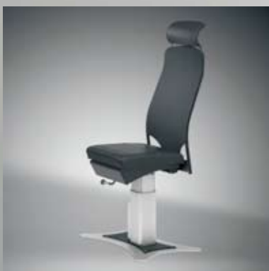
Oberteil 360° drehbar mit Rastung 90° / Rückenlehnenneigung bis 15° / Rotary mechanic 360° with locking 90° / Back rest inclination up to 15°