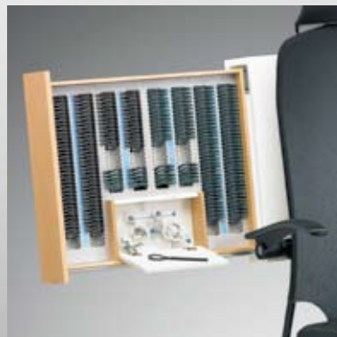
Gläserkasten, groß / Armlehnen, verstellbar / Trial lens drawer, large / tilting arm rests