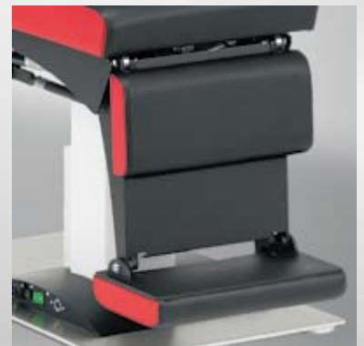
Fußstütze klappbar / Folding foot support