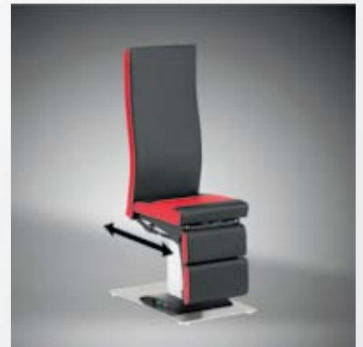
Sitzverschiebung, elektromotorisch oder manuell / Seat displacement, electromotive or manual