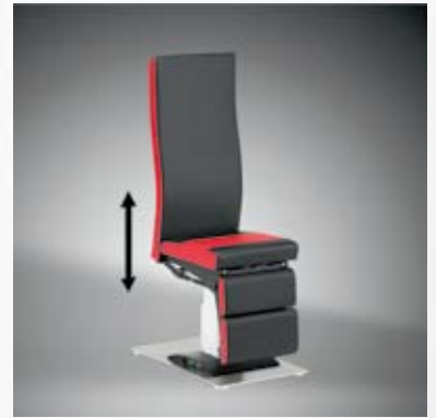
Höhenverstellbar / Height adjustable