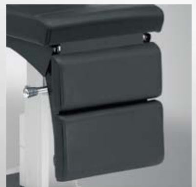
Beinauflage / Foot rest