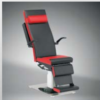
Rückenlehne stufenlos neigbar / Back rest continuously inclinable