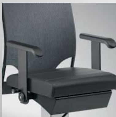
Armlehnen starr / Arm rests fixed