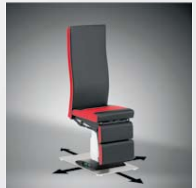
Stuhlverschiebevorrichtung / Chair displacement