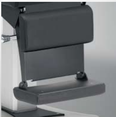
Fußstütze klappbar / Folding foot support