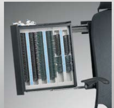
Gläserkasten, klein / Armlehnen verstellbar / Trial lens drawer, small / tilting arm rests